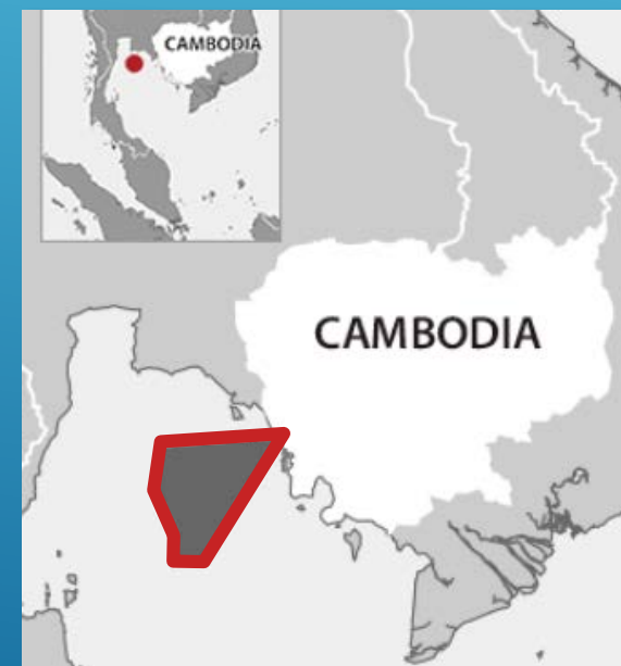
当社が権益を保有するエリア