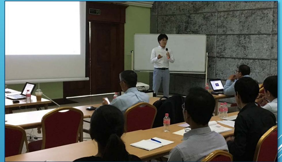
技術セミナーの様子 (2019年10月)